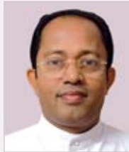
ഫാ. തട്ടിൽ സോളി