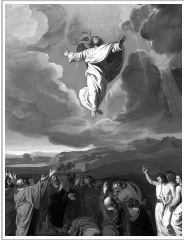
The Ascension of the Lord May 29