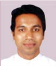
ഫാ. നടക്കേവേലിയിൽ ചാക്കോ